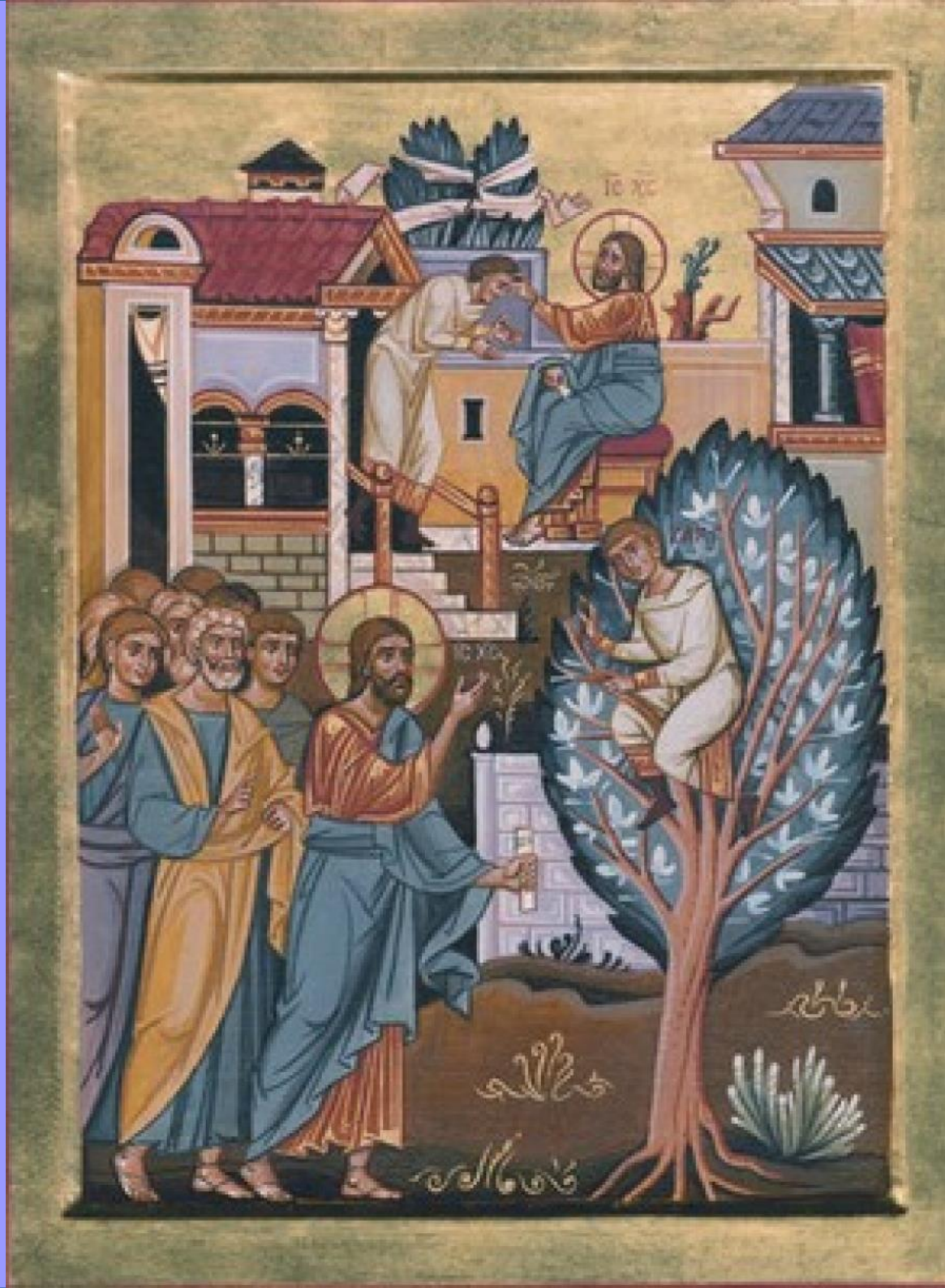
Icône orthodoxe de Zachée