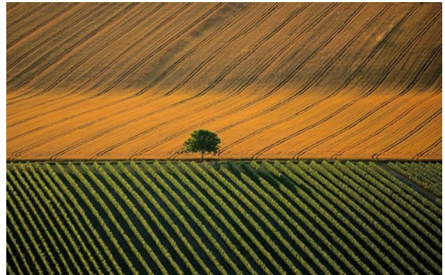
Près de Cognac (France)

Avec Jésus, au désert ! Terre de nos rêves, terre mystérieuse. Terre de mort, terre désolée sans eau où toutes traces s'effacent. Terre de la vie qui surgit. Animale et végétale, vie aussi discrète qu'inattendue.