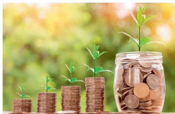
Monnaie, monnaie ?