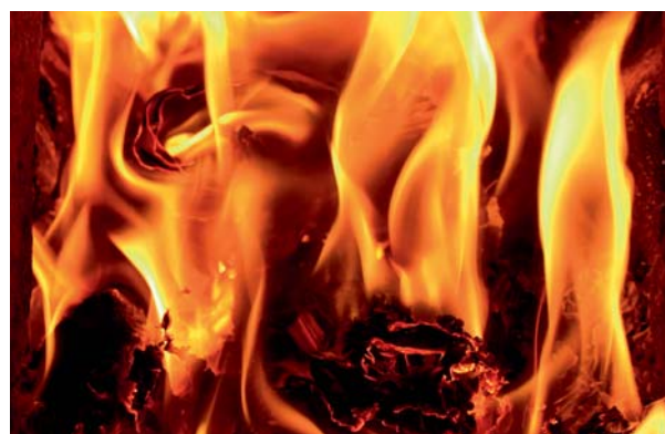
L'Esprit, comme des flammes de feu