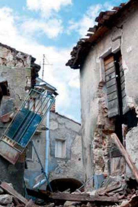
L'urgence de la conversion

Les catastrophes ne manquent pas, les infos sont là pour nous les égrener. Catastrophes naturelles mais aussi celles que nous provoquons quand nous manquons de respect, de responsabilité, quand nous laissons la haine nous envahir. Devant ces catastrophes, nous ergotons, nous nous rassurons au jeu du « C'est pas moi- c'est l'autre ». Nous cherchons un coupable.